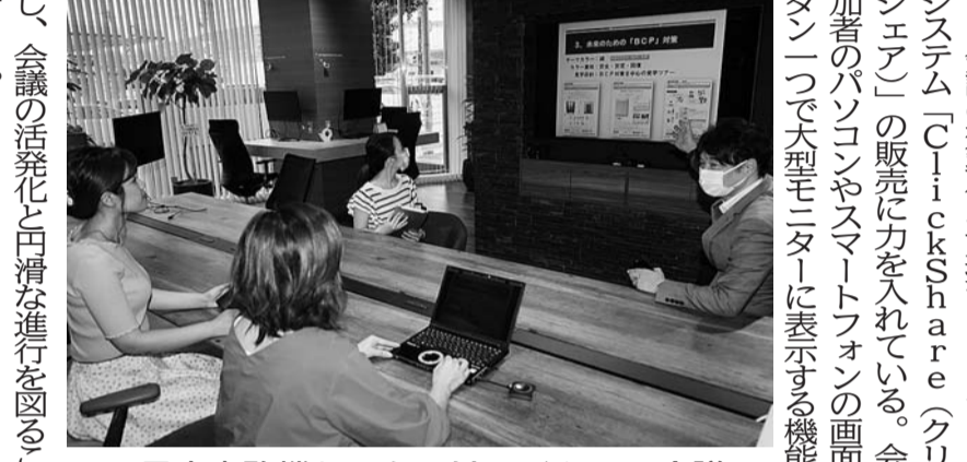
四日市事務機センターはワイヤレス会議システムの販売に力を入れる

自動車用エンジン部品や銃前部品などの切削加工を手掛ける高洋電機(本社玉城町中東高祖雅社社長、電話0590・500・2121)は、タンクステンなど、高精度の金属の精密加工に強みを持つ。タンクステンの加工で精度を高めるには、研磨を行うのが一般的。