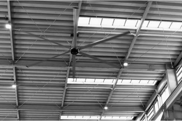
換気対策として需要が高まっているゴーリキの「スマイルファン」

7.3の大きな羽が6枚ついたファンで天井に設置して使用する。ゆっくりと回転しながら、空間内に気流を作る。 消費電力はドライヤー1台とほぼ同等の1300ワット。1台で1500平方メートルの空間をカバーできる。回転速度の調整も可能だ。冬場には結露の防止にも役立つ。 強力社長は「職場環境が悪いと離職率が上がってしまう。人手不足などに悩む、工場や倉庫で、人材の定着に寄与できれば」と話す。